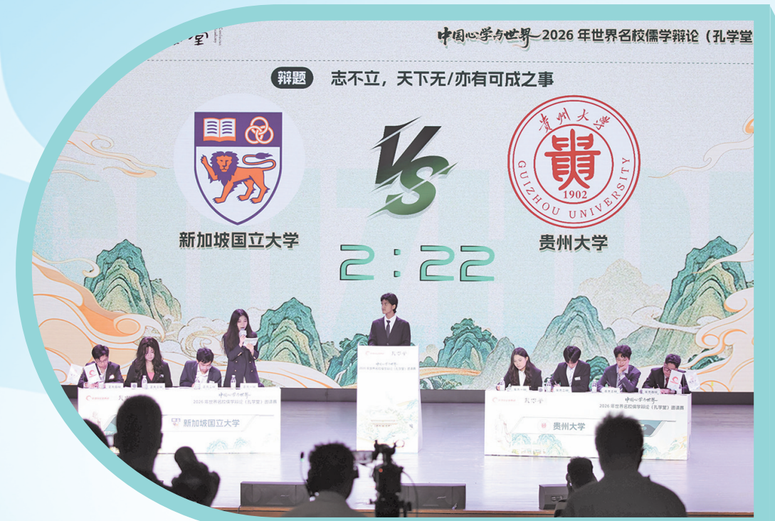
首场比赛中，贵州大学对阵新加坡国立大学。