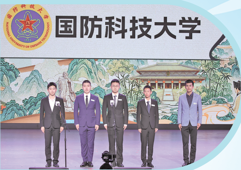
国防科技大学辩论队。

“中国心学与世界”2026年世界名校儒学辩论(孔学堂)邀请赛于5月26日至27日在贵阳孔学堂阳明大讲堂开赛。赛事以儒学为核心，汇聚海内外名校辩手，围绕“中国心学与世界”为主题展开深度思辨交锋。首场比赛中，贵州大学对阵新加坡国立大学，最终贵州大学凭借更严密的逻辑推演与更贴合主题的阐释，取得首场比赛的胜利。