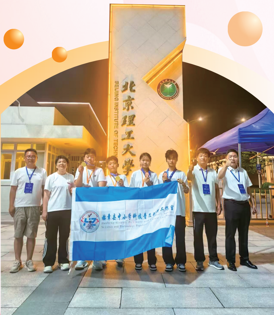
赫章县学生参加科技大赛留影。

长机会，更不能让资源壁垒阻碍县域教育高质量发展前行。”怀揣着助力山区学子逐梦科创的赤诚初心，高杰主动扛起全县科技教育统筹发展重任。2023年3月，依托县教育局成立科学技术普及创作工作室，确立打破资源壁垒、普惠均衡育人发展理念，全力探索构建“共学·共享·共进”科技教育共同体，让科技之光照亮了乌蒙山区学子。