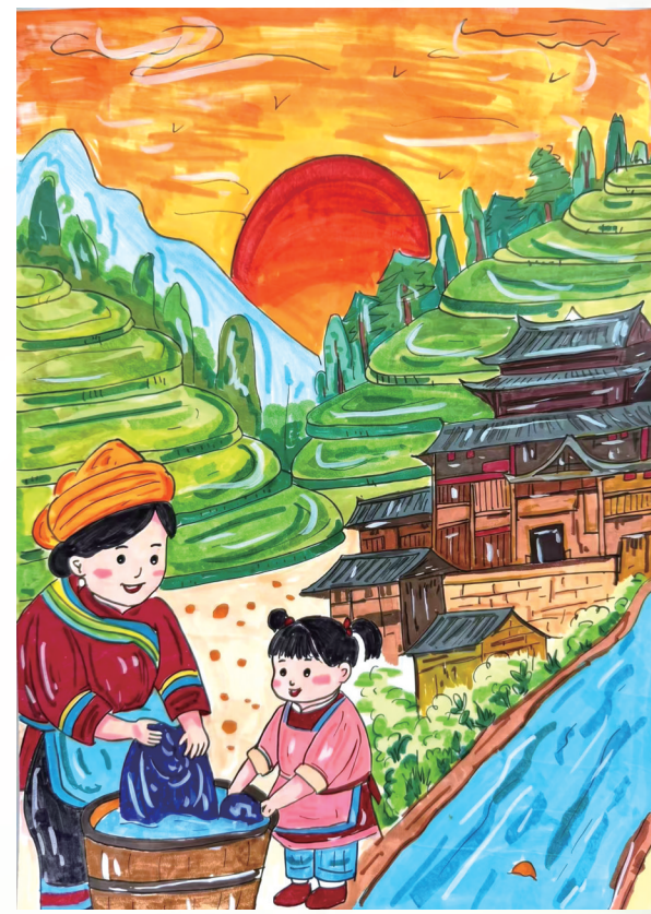
梯田下的洗衣时光