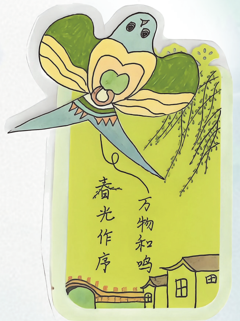
《春光作序 万物和鸣》