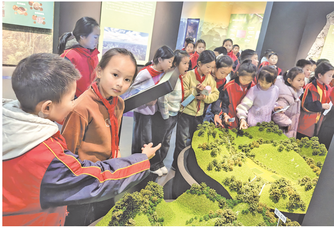
荔波小七孔研学活动。