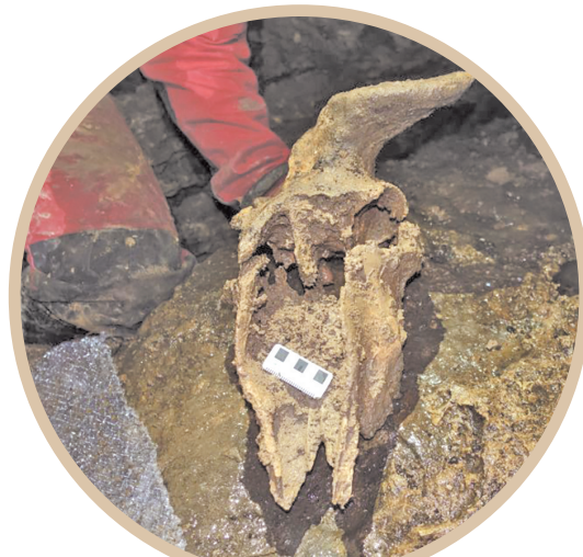
在贵州绥阳双河洞发掘现场发现的羚羊头骨。

此外，科研人员已在双河洞内发现52具大熊猫化石遗骸，主要为晚更新世巴氏大熊猫，洞中大熊猫化石数量多、保存完好，备受关注。同时期还发现苏门答腊犀、剑齿象、鬣羚等动物化石遗骸，这表明羚羊很可能是中国西南山区中晚更新世“大熊猫—剑齿象动物群”的重要成员之一。