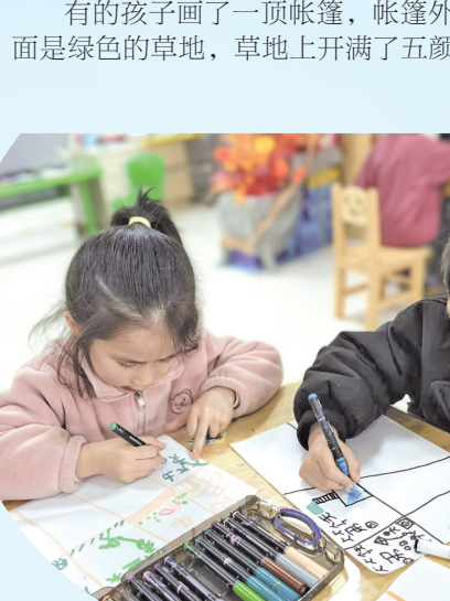
孩子们画下自己的春假计划。

那一刻，他们真正感受到了：“我”的计划很重要，但“我们”的想法也同样值得倾听。而把自己的兴奋分享给别人，快乐好像加倍了!” “把计划权还给我们!” 孩子们的画作一张张贴在墙上，老师一张张地看，一张一张地品。他们发现，大多数孩子都把“陪伴”画在了画面的正中央——和爸爸妈妈放风筝、和家人走进田野、回老家看长辈。原来，孩子们心里最想要的，不是去多远的地方、玩多贵的玩具，而是和爱的人在一起。 孩子们对走进田野、拥抱自然的向往，更让老师们看到了一个机会：与其在教室里讲述春天，不如把课堂搬