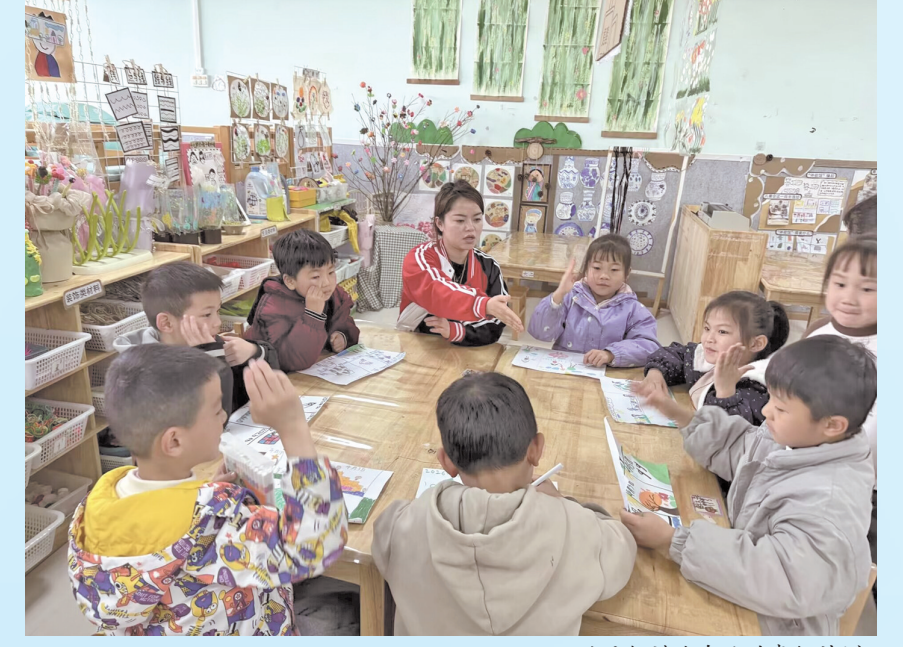
孩子们讲述自己的春假计划。

春天来了，春假也来了。可在惠水县第四幼儿园，这个春假有点不一样——不是老师告诉孩子“春假要做什么”，而是孩子们自己告诉老师：“我们要这样过春假!” “春假?那是春天放的假吗?” 当大家都在讨论春假这个热门话题时，惠水县第四幼儿园的老师们没有直接告诉孩子“春假是什么”，而是蹲下身来，轻声问道：“你们知道什么是春假吗?” 话语刚落，教室里瞬间炸开了锅。“是放假吗?”一个孩子试探着说。紧接着，更多的小脑袋凑了过来，眼睛里闪着光。“春假……是春天放的假吗?”“那我们可以去田里吗?”“去看花开了没有!”“还可以放风筝，对吧?”“我想在草地上打滚!” 孩子们的小手举得高高的，你一言我一语，天真烂漫的话语从他们口中蹦出来，脸上写满了期待与兴奋。教室外春光还要明媚。