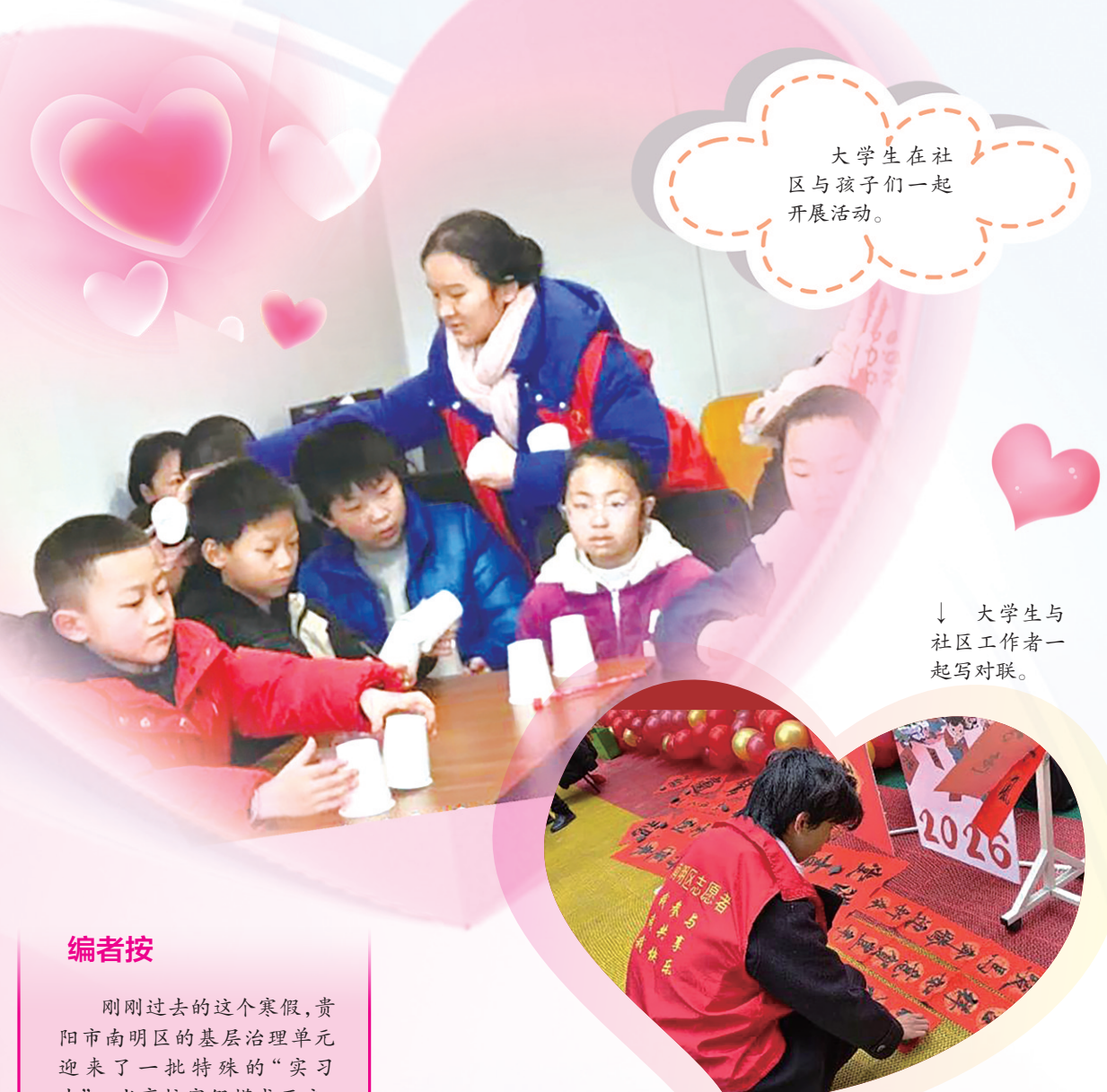
大学生在社区与孩子们一起开展活动。

者”成长为“服务者”，也更加理解基层工作的温度与分量。此次“返家乡”实践活动虽已结束，但服务家乡、回馈社会的初心才刚刚启程。未来，我将带着这份收获，努力成为有温度、有担当的人，用实际行动为家乡贡献青春力量。