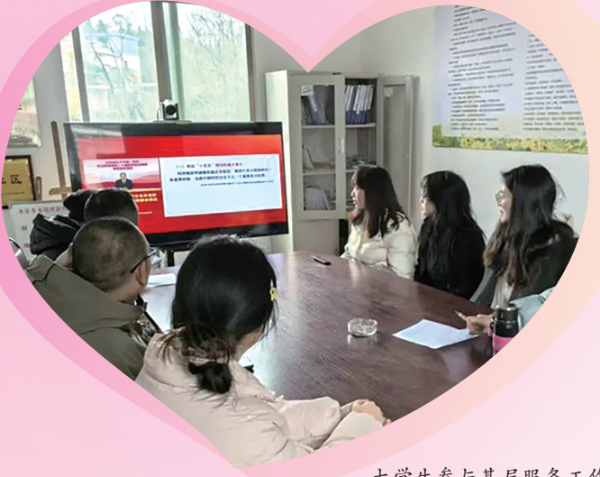
大学生参与基层服务工作。