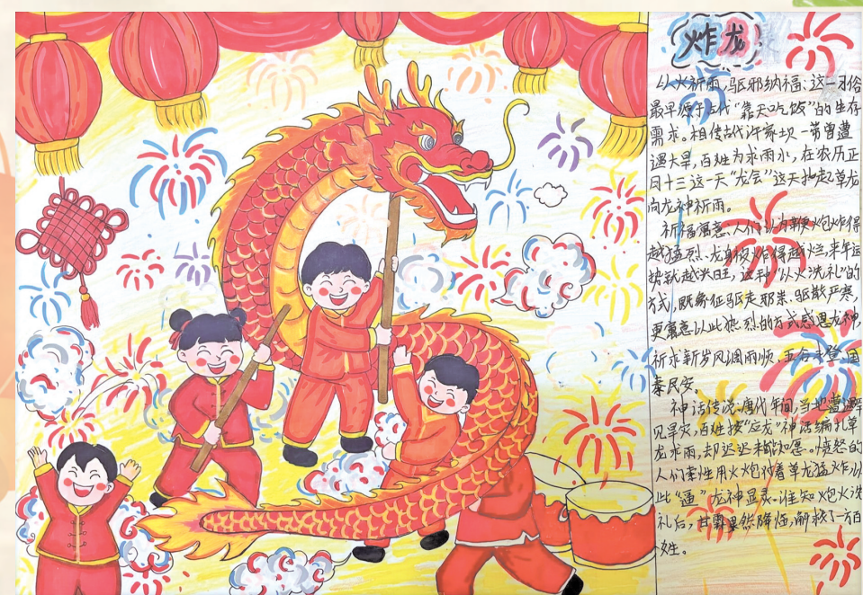
思南县第一小学四(2)班 廖德姚 指导老师：周迪

子，它们个个昂首挺胸，像精神抖擞的士兵，整齐地排列着。再看看自己包的，竟也有模有样，我心里暗自得意，觉得自己似乎得了奶奶的真传。而妹妹包的饺子，真是形态各异！有的扁扁的，像随风飘落的树叶；有的胖胖的，像憨态可掬的胖娃娃；还有的简直就是个“四不像”的怪物！我忍不住把妹妹的“杰作”指给奶奶看，奶奶没忍住，噗嗤一声笑了出来，笑声在厨房里回荡。 锅里的水开始翻滚，上方隐约有一丝雾气升腾，宛如一层薄纱。一个个饺子迫不及待地扑通扑通跳进锅里，在水中上下翻滚着，仿佛是一群欢快的小精灵在游泳、跳舞。不大一会儿，饺子全都浮了起来，变得白白胖胖的，像一个个可爱的小元宝。奶奶熟练地舀起饺子，装在碗里，端到桌上。全家人围坐在一起，一边吃着热气腾腾的饺子，一边诉说着过去一年里的点点滴滴，那温馨的氛围，如同冬日里的暖阳，温暖而美好。 这小小的饺子，如同一个神奇的容器，包着家乡的年味，也藏着最朴实的幸福。 指导老师：韦勤