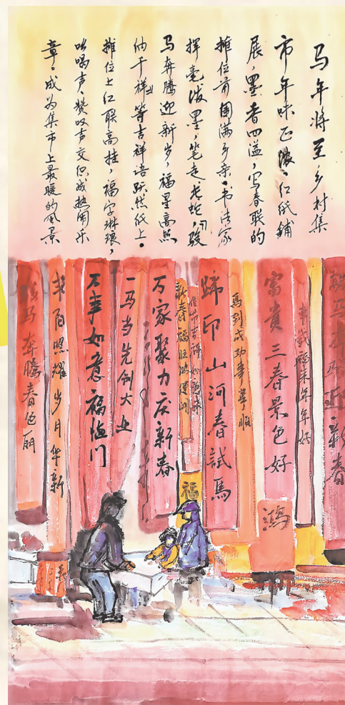
思南县第一小学六年级 田博轩 指导老师：曾蓉