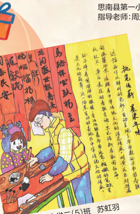
思南县第一小学二(5)班 苏虹羽 指导老师：秦丽