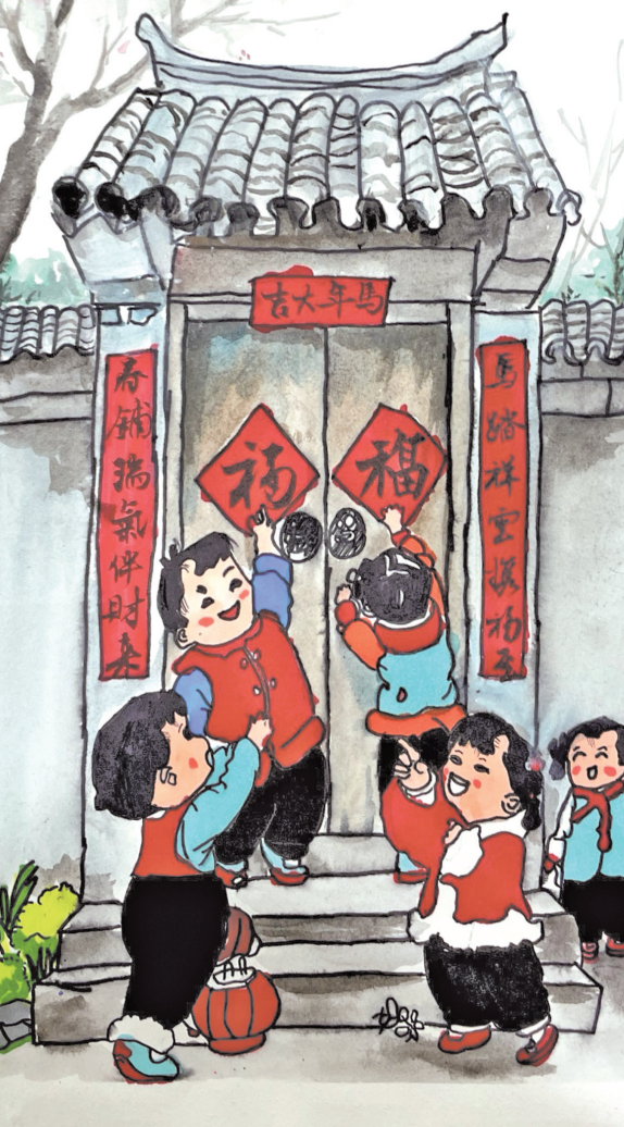
思南县第一小学二(10)班 胡可鑫 指导老师：冯晓丽