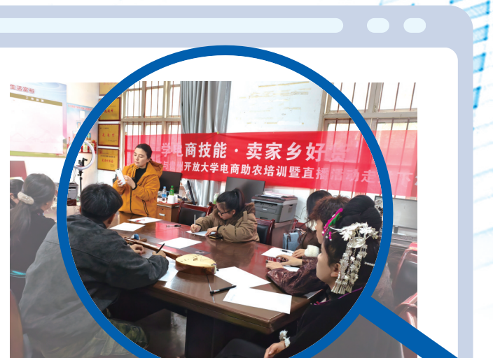
直播前的电商培训。