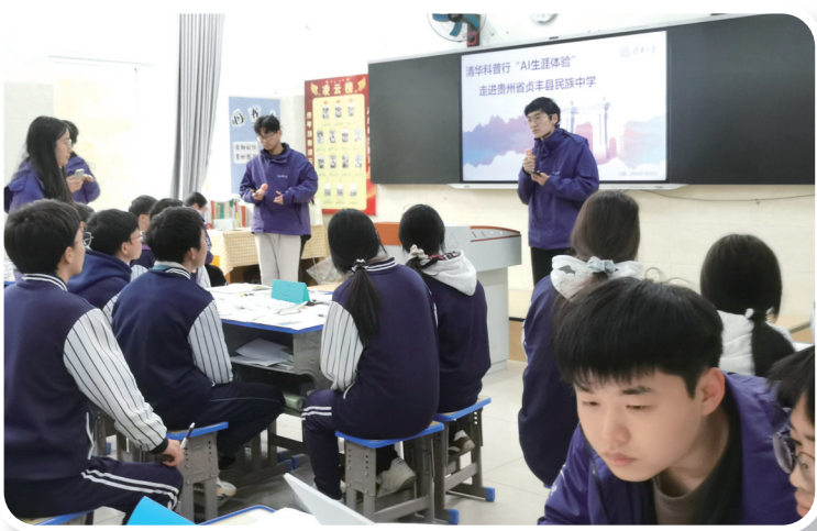
清华学子分享学习经验。

活动现场，“生涯幻游”环节兼具科技感与思想性，成为学子们感悟个人成长与民族发展紧密关联的重要载体。在清华研究生的专业指导下，同学们运用豆包AI，结合自身