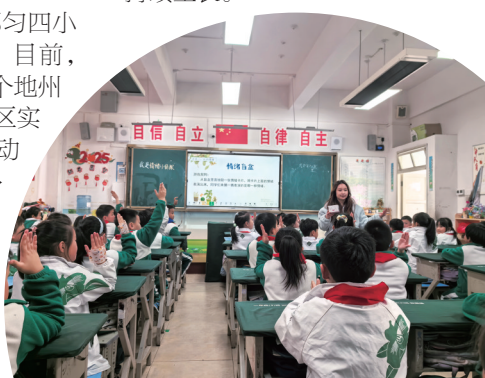
教师执教生命教育校本课程《接纳生命》。