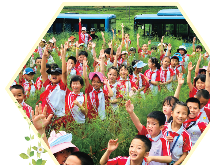
“学校—社会”移动式课堂。

近年来，黔南州都匀市第四完全小学以“聚焦生命性，培育阳光少年”为核心航向，历经十载深耕求索，创新构建“课程、课堂、评估”三擎驱动育人模式，逐步形成“理念引领、多维联动、动态评价”的一体化育人格局。这一实践推动生命教育在校园内由探索走向系统、由理念走向常态，不仅让生命教育真正落地生根，也凝练出一套具有推广价值的区域生命教育实践范式。