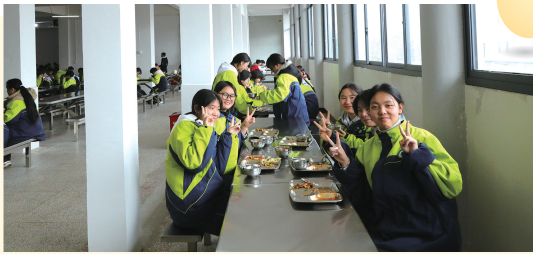
我们每天都吃得很安逸。