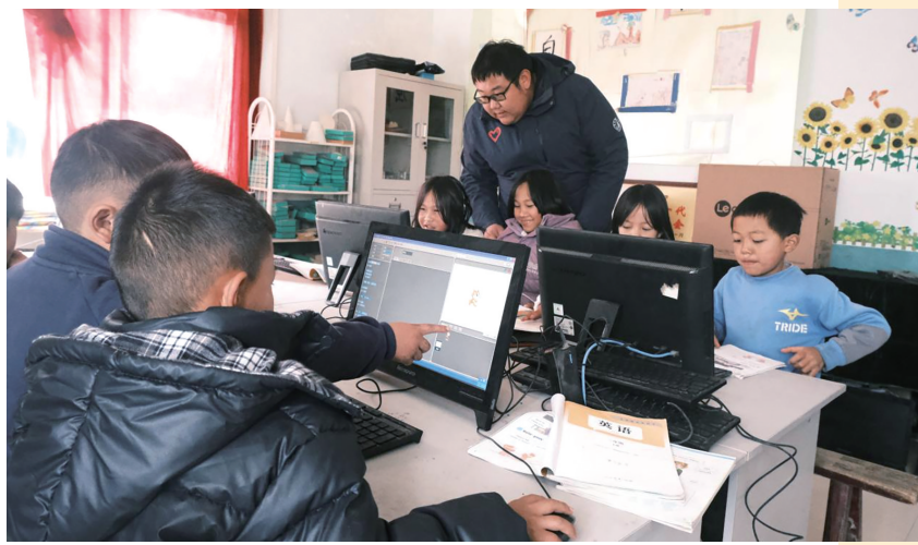
本禹志愿服务队研究生支教团线下实践。

此次“少儿编程进大山”活动，正是“玩转科学”系列科普活动在数智教育领域的全新延伸。项目不再局限于传统的线下实验演示，而是将目光投向了屏幕与代码，致力于通过“少儿编程”这一前沿窗口，帮助乡村学子跨越城乡“数字鸿沟”。