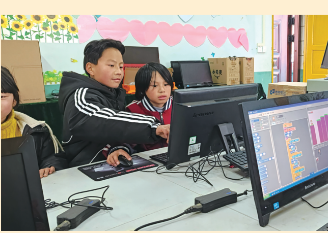
孩子们正在通过Scratch制作小游戏。

从最初的对电脑一窍不通，到结业时能独立制作小动画，孩子们的变化令人惊喜。在结业展示上，每个小组都利用Scratch制作了一个完整的小游戏。