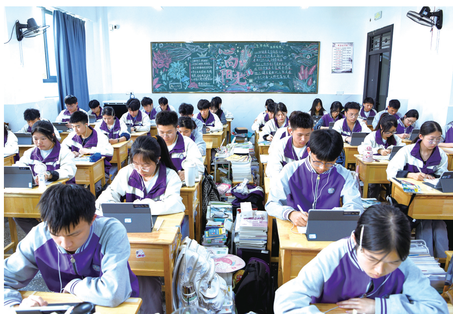
黔西市树立中学德育课堂。

德育是立校之本、育人之基。近年来,贵州省多所中小学跳出“说教式”德育传统模式,以日常浸润、课程融合、实践赋能等为抓手,构建德育新生态,让立德树人的种子在校园生根发芽、开花结果。