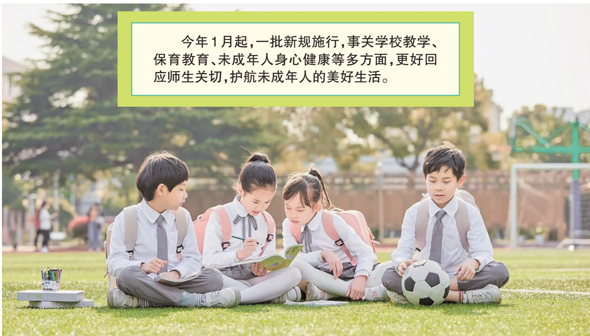
今年1月起,一批新规施行,事关学校教学、保育教育、未成年人身心健康等多方面,更好回应师生关切,护航未成年人的美好生活。

新修订的《中华人民共和国治安管理处罚法》(2026年版)1月1日起施行,其中第六十条明确规定,对“以殴打、侮辱、恐吓等方式实施学生欺凌,违反治安管理”者,公安机关应当依法给予治安管理处罚,采取相应矫治教育等措施。同时,对学校“明知发生严重的学生欺凌或者明知发生其他侵害未成年学生的犯罪,未按规定报告或者处置的”,除责令整改外,还建议有关部门依法处分其直接负责的主管人员和其他责任人员。