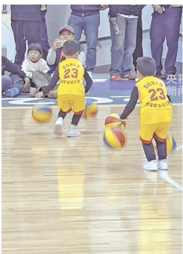
孩子们临场应变默契配合。

近日,一段幼儿园小朋友篮球表演的视频在网络上广泛传播。表演中一颗篮球意外滚落,但这场看似出现失误的表演却赢得了无数网友的点赞。