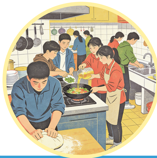
大学生在厨房抢着上劳动课。(AI生成)

36个名额,300多人选,十分之一的随机选中概率,让烹饪课稳坐“最难抢课程”的宝座。这已经是我在选课系统中勾选烹饪课的第三个学期,去年,我还在“即选即得”阶段默默蹲守,暗自期望有人退课。