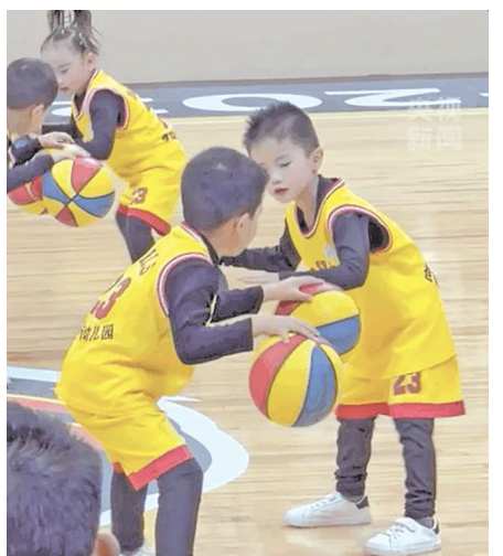
队友默契配合着他进行空手拍球。