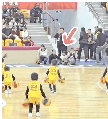
小朋友手中的篮球意外滚走。