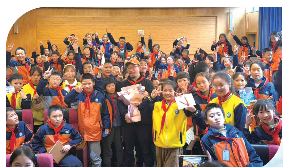
公益讲座在贵阳多所学校陆续开展。

作为“未成年人思想道德建设”的重要举措，本次“建设书香校园”名家公益讲座系列活动，不仅为贵阳校园注入了浓厚的书香气息，更通过榜样人物的引领作用，有效提升了青少年的文学素养，促进了校园文化建设。未来，主办方将继续搭建优质文化交流平台，让更多优秀作家走进校园，让阅读成为青少年成长的重要伙伴，为培养担当民族复兴大任的时代新人筑牢根基。