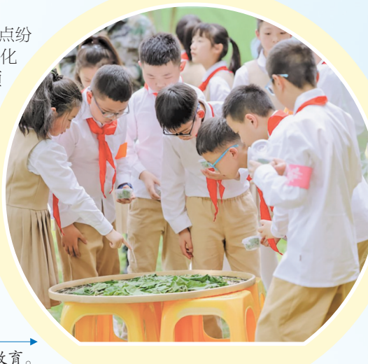
全市开展素质教育。

各区县创新实践亮点纷呈:观山湖区实施智慧化教学质量提升工程项目,息烽县推广5G+精准教学督导,白云区探索高效率、高精度的综合素质评价、花溪区深化“三个课堂”应用,南明区通过“央馆领航社素质课”项目构建“YI”教育课程体系……数字技术正深刻重塑贵阳教育生态。