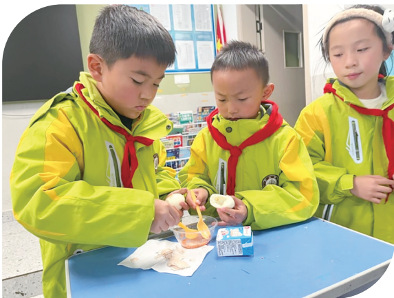
有了“灵魂”蘸料，学生们胃口大开。