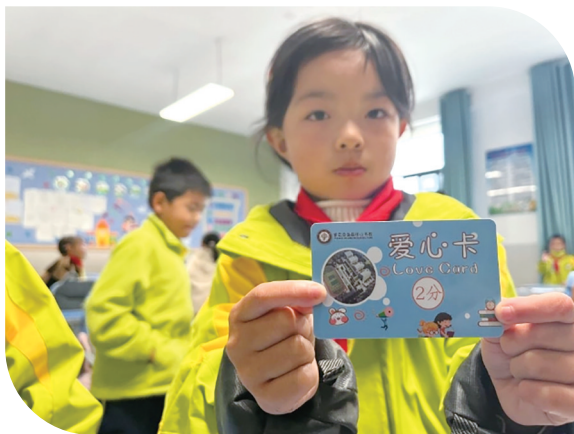
爱心积分卡可以到超市兑换礼物。

据了解，为进一步提升校园餐质量、保障学生营养摄入，贵州省推行营养餐“四个一”核心膳食要求，即每个学生每天一个鸡蛋、一两肉、