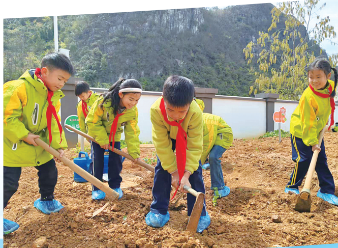
在劳动中收获知识。