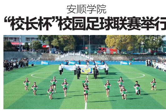
开幕式上精彩纷呈的文体表演轮番上演。

“飞花令上见真章” 福泉五小师生玩转诗词大会 本报讯(特约通讯员 韦斌)书香浸润校园,诗情点亮童年。近日,黔南州福泉市第五小学举办“校园古风诗·诗词润童心”诗词大会。活动创新设置“师者先行”与“童心飞扬”两大环节,师生同台,以诗会友,共赴一场沉浸式诗词文化盛宴。 活动在教师诗词竞赛中正式启幕。平日在讲台上循循善诱的教师们,此刻化身胸藏文墨的吟咏者。他们从容应对必答题,敏捷角逐抢答题,更在“飞花令”环节妙语连珠——围绕“风”“月”“春”“秋”等关键字,诗句如流,佳韵迭出,展开一场诗与才思的精彩交锋,赢得全场阵阵赞叹。教师们以深厚的文学积淀与优雅的比赛风范,为整场活动奠定了高雅而热烈的文化基调。 紧接着,学生决赛将现场气氛推向高潮。各年级遴选出的诗词小达人们,在必答题中沉着稳重,在抢答题中机敏迅捷,在“飞花令”环节更显才情——以“花”“雪”“水”为引,你接我续,吟诵不绝,既展现出丰厚的诗词积累,也彰显了敏捷的思维与从容的气度,引得现场掌声连连。师生同台竞技,诗意接力,生动诠释了文化传承的温度与深度。