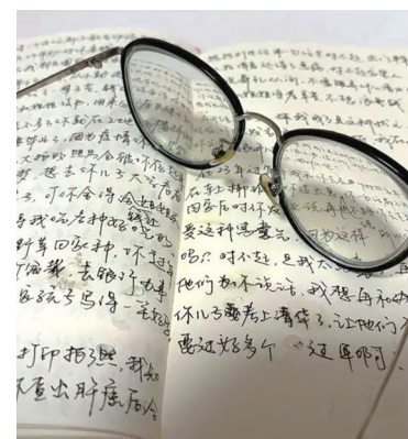
鄢开耀写的信局部。