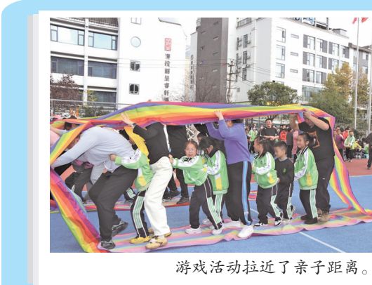
游戏活动拉近了亲子距离。

这些比赛生动诠释了“像石榴籽一样紧紧抱在一起”的深刻内涵。一名学生在赛后激动地说：“当我们齐声喊着口号冲向终点时，真正感受到了团结的力量！”这种切身体验让同学们深刻认识到，唯有众志成城，方能克服困难、赢得胜利。