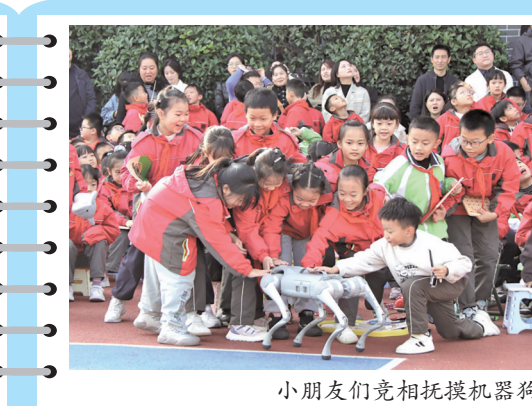
小朋友们竞相托举机器狗。