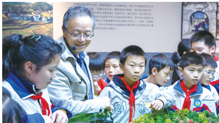
同学们参观安顺学院地质博物馆。

基地,互动体验区格外热闹。学生们通过模拟操作,亲身体验了网络安全的重要性。这种寓教于乐的方式,让原本抽象的网络安全知识变得直观而深刻。为确保活动安全有序,安顺学院制定了详细工作方案,35名志愿者全程引导,安保人员在各关键点位值守,后勤保障充分到位。各部门通力协作,为孩子们打造了一场安全而精彩的科普之旅。据悉,此次开放活动是贯彻落实《贵州省教育厅关于全省高校实验室等场所面向中小小学生开放的意见》的具体举措。活动将分5个批次进行,预计将接待来自13所中小小学(教育集团)的近1000名师生。安顺学院相关负责人表示,高校场馆向中小小学生开放,不仅能够拓宽孩子们的视野,激发他们对科学文化的兴趣,更能有效促进大中小学教育的有机衔接。让博物馆的实物成为最生动的教材,让高校资源惠及更多中小小学生,这是高校服务地方教育的重要途径。