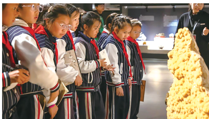
同学们参观安顺学院校史馆。