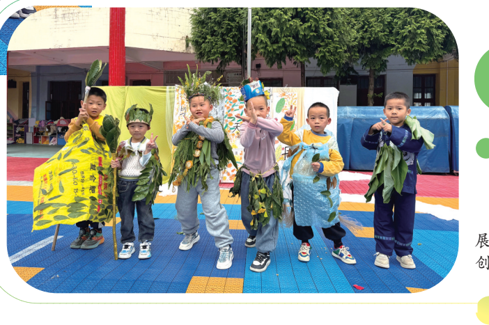
孩子们展示自己的创意服饰。