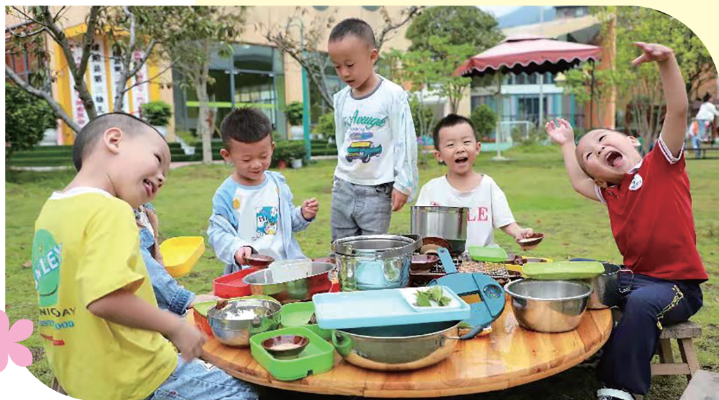
小朋友亲自动手当上「小厨师」。