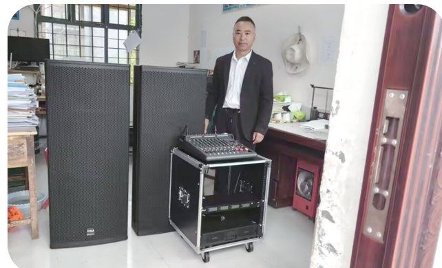
安柱小学的音响设备。