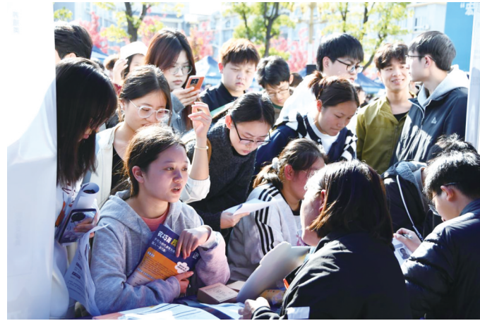
毕业生与用人单位工作人员交流沟通。

本次活动的成功举办，为2026届贵州省高校毕业生就业工作全面展开按下了“加速键”。有关部门表示，将以此次活动为契机，持续拓宽就业渠道，强化就业指导与服务，推动人才培养与地方经济社会发展需求紧密对接，助力毕业生投身中国式现代化贵州实践中，书写属于新时代的青春答卷。