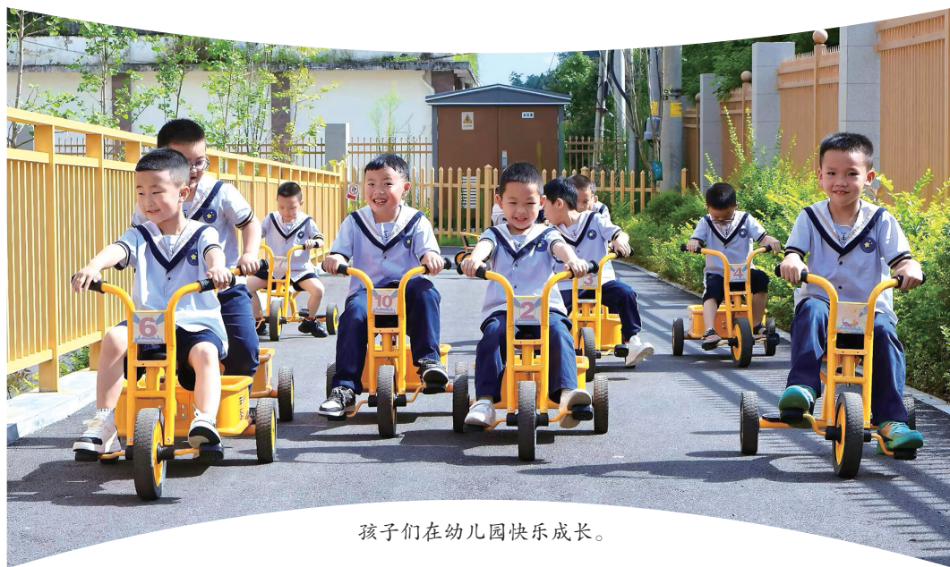
孩子们在幼儿园快乐成长。

自2023年创办以来,黔西南州晴隆县安宝幼儿园秉持“每颗星星都会发光”的育人理念,在不到两年时间里,先后获评“州级先进集体”“州级示范幼儿园”,成为黔西南州学前教育领域一颗冉冉升起的“新星”。这所由安宝煤矿与当地企业携手投资兴建的民生项目,不仅是安宝煤矿履行社会责任、政府深耕民生教育的共同成果,更是园所全体教职工以“教育初心”破解县城幼教难题的生动实践。