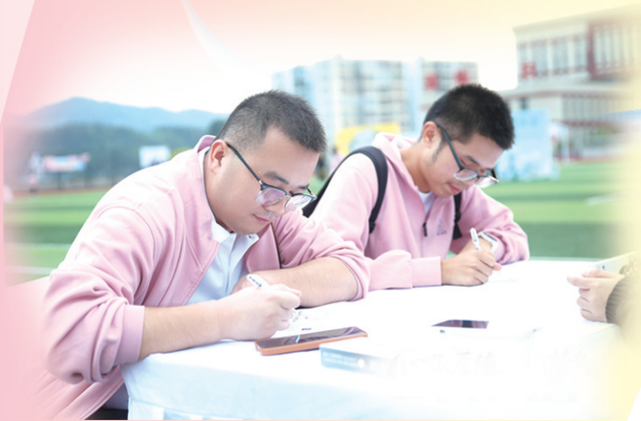
学子写一封信寄给10年后的自己。