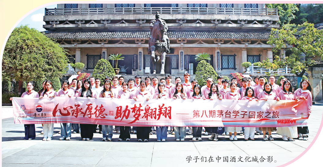
学子们在中国酒文化城合影。