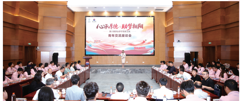
青年交流座谈会现场。

自2016年起，“茅台学子回家之旅”已成为受助学子感受茅台文化、凝聚情感的重要平台。此次活动不仅是一次感恩回归，更是一场成长对话。“我们想让孩子们知道，茅台愿成为你们成长路上的同行者。”茅台集团党委书记、董事长张德芹在座谈会上动情地说。