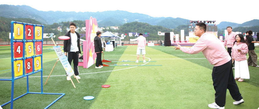
正在参加击退烦恼飞盘运动的学子。

10月12日下午，学子们参观了遵义会议会址。在庄严肃穆的展厅里，在一幅幅历史照片、一件件珍贵文物前，讲解员讲述着四渡赤水的智慧、长征路上的坚韧。