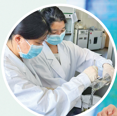
↑铜仁职业技术学院“茶源微丸”团队开展废弃茶枝叶成分提取实验。(受访者供图)

近年来，贵州职业教育紧扣产业发展所需，强化内涵建设，多措并举创新，助力一片片原生态“绿叶”悄然蜕变成富民强省的“金叶”。