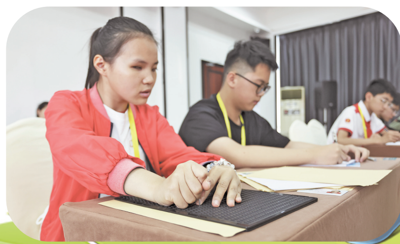
一名视障学生参加比赛。