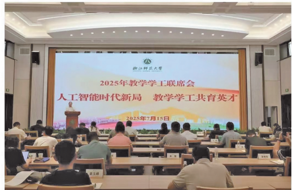
浙师大官微发布去绩点改革消息。

为切实减轻学生学业负担，激发学生内生学习动力，学校全面启动P/NP课程评价改革。此次改革以优化学业评价机制为核心，旨在破除“唯绩点论”，给予学生更多试错空间，引导学生进行自主个性化发展。