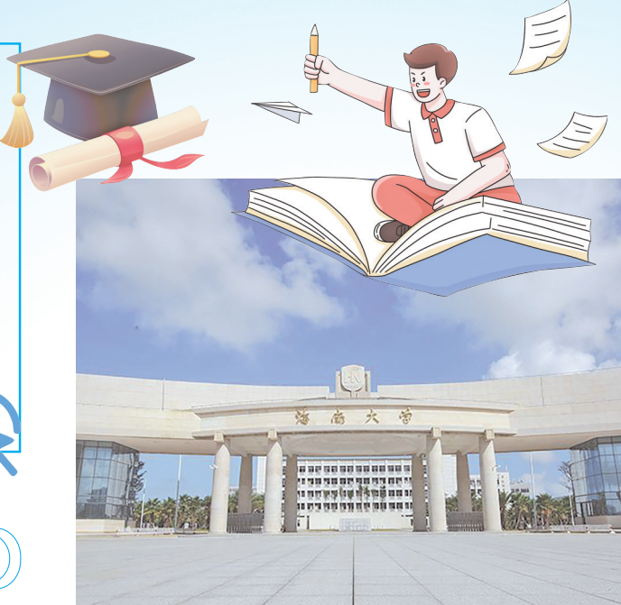
海南大学外景图。

一场教育改革的“星火”正在大学校园里燃起。 今年以来，北京大学、海南大学、浙江师范大学等省外多所高校纷纷宣布对学业评价体系进行调整。 调整的重点聚焦于一个关键词——绩点：破除“唯分数论”，取消或弱化沿用已久的绩点制度，缓解校园内卷现象，让学生不再“绑在成绩的战车上”，而是关注知识本身和学习过程。 让很多大学生又爱又恨的绩点是什么？没有绩点，能否带来教育“退卷”？