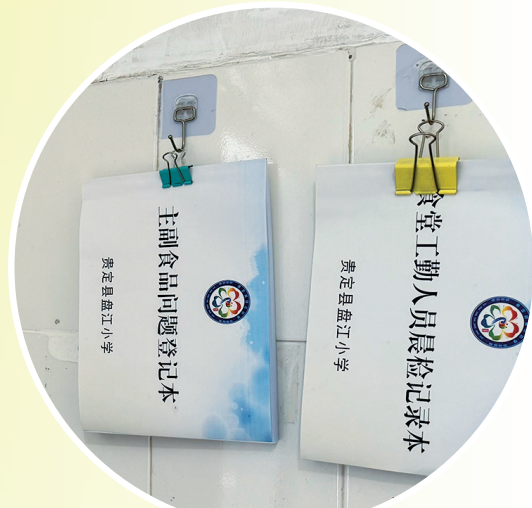
各种记录本，登记晨检内容。

评课议课时，各县(区)教师代表进行了深入交流，分享了授课教师的优势与特色，也提出了针对性的优化建议。