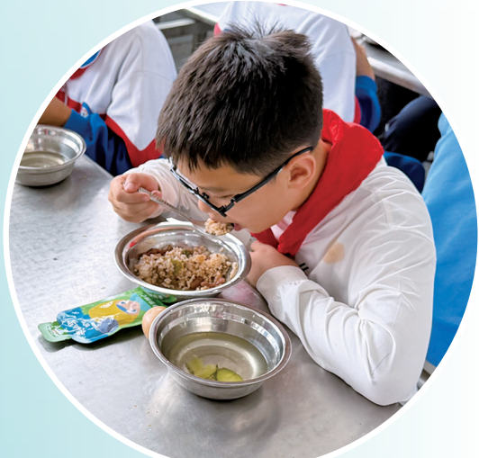
孩子们吃上热腾腾的饭菜。