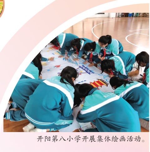
开阳第八小学开展集体绘画活动。

终评选出三（4）班的《问月》、四（3）班的《英雄》为一等奖，其余节目分获二、三等奖。此次大赛以诗词为纽带，让中秋“月韵”与国庆“国魂”在校园交融，不仅展现了学生的艺术风采，更让中华诗词文化与家国情怀实现了深度浸润。