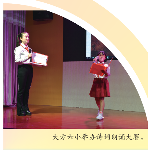
大方六小举办诗词朗诵大赛。