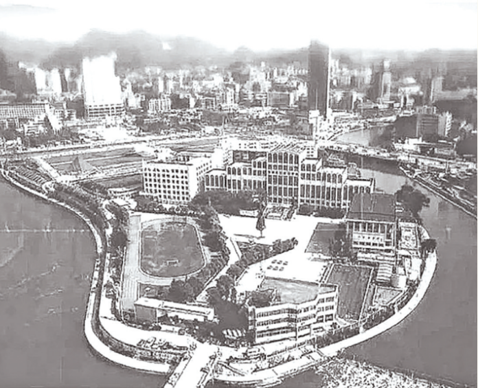
2005年贵阳一中未迁出前的旧貌。

正是从明万历年间开始,南明河渔矶湾两岸,一大批筑城的“达官贵人”“乡贤名流”“骚人雅士”,相继构筑了许多园林池馆、堂轩楼榭、亭阁精舍。据有关史志记载,有越玉岑“占断南明水一湾”的“南园江阁”,有或说“玉岑之子”“一生傲骨奇肠,悲壮侠气”的杰出诗人越其杰的“溪园”。有越氏姻亲、晚明著名乡贤杨师孔及其子“诗书画三绝”杨龙友“石林精舍”(今石岭街)。有“天末才子”“侠骨文心”的谢三秀紧邻“溪园”的“远条堂”。有比杨师孔中举早九年、谢三秀的知己、参与平“安邦彦叛”殉难的李承明的“吟望亭”。此外,还有如“汤明府别墅”“萧秀律曲溪”等,均皆占尽南明河渔矶湾的人文风情,留下几多历史的佳迹胜景。这批乡贤文人雅士,或著书立说,或聚徒讲论,或燕觞畅咏,或悠游唱和。就连时出任贵州的封疆大吏郭子章、江东之等人,政暇亦参与其中,宴乐吟咏,交流时政。不言而喻,贵阳南明河的渔矶湾,也就自然而然成了黔中省垣的文化摇篮。而这一切,又以甲秀楼的建设为标记。