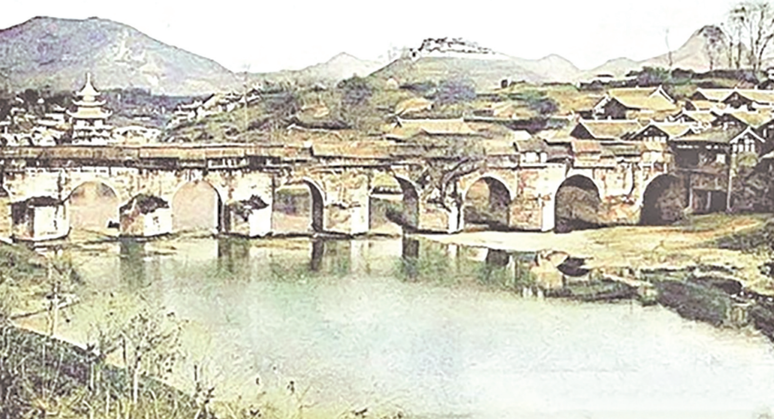
南明河曾被称为南门河、襄阳河、向阳河。

嘉靖二十年(1541),有阳明先生的及门弟子、楚中王门大师湖湘武陵桃冈蒋信,提学黔中,甫下车,见文明书院衰败景象,顿生“人存政举,人亡政息”之慨叹。遂决意以复兴书院、振兴师学为首事。倡捐积金,仅越月而大功告成。书院复兴,学子蜂拥云集,蒋信亲临讲授,传播阳明心学,书院已不能容。故又在书院右新建正学书院,进一步扩大传播心学,培育贵州人才。贵州自此风气大开,人文渐胜,人才辈出。然而贵州自永乐十一年(1413)置省以来,人文虽盛极一时,但一直未得单独开科取士。洪熙元年(1425),令贵州士子就试湖广。宣德四年(1429),又令贵州学士改赴云南乡试。如此折腾再三,贵州士人,真是苦不堪言,且中试者寥寥。至嘉靖时,有思南乡贤田秋,时为谏官,便向明朝中央上疏,请求于贵州设试院单独开科取士。继而巡按王杏又请,遂于嘉靖十四年(1535)得准,定解额二十五人。并于嘉靖十六年(1537)丁酉科,正式与云南分试。从此以后贵州人文教化为一振,黔中科甲亦长足挺秀。