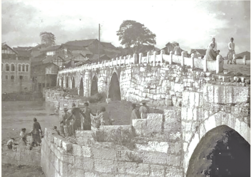
民国时期贵阳的南明桥。

至于南明区至今犹存的山川形胜、人文佳景,不妨在阳明路上漫步,聆听黔明古寺的晨钟暮鼓,或可登临南岳山麓,感怀南岳山寺兴废,抒发思古之幽情。抑或攀登仙人洞,领略道教文化的太极上清。有兴更可登上“扼城南之咽喉,为湘黔之孔道”“一山高据翠微巔”的图云关,想前人羁旅之艰辛,忆抗战英烈之伟绩。俯瞰南明霓虹放彩,流光跃金;仰望乡关日新月异,小康温馨。大好河山,尽收眼底;雄关漫道,致远尽兴。