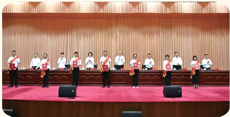
教师表彰大会现场。

会议强调,要坚持固本铸魂,深化“红色思政大课堂”品牌建设,创新推动“五育融合”实践路