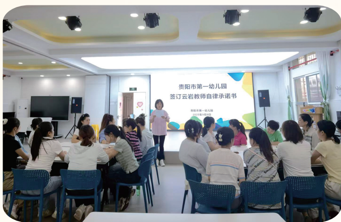
云岩区拟定教师自律承诺。

在理想信念与法律层面,要求教师“决不动摇理想信念”,忠诚于党和人民的事业,做社会主义核心价值观的践行者;“决不触碰法律红线”,依法执教、廉洁从教,维护纯净的教育生态。