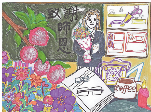
《致谢师恩》 黔东南州册亨县第三中学八(1)班 杨春媛 指导老师:陆金凤