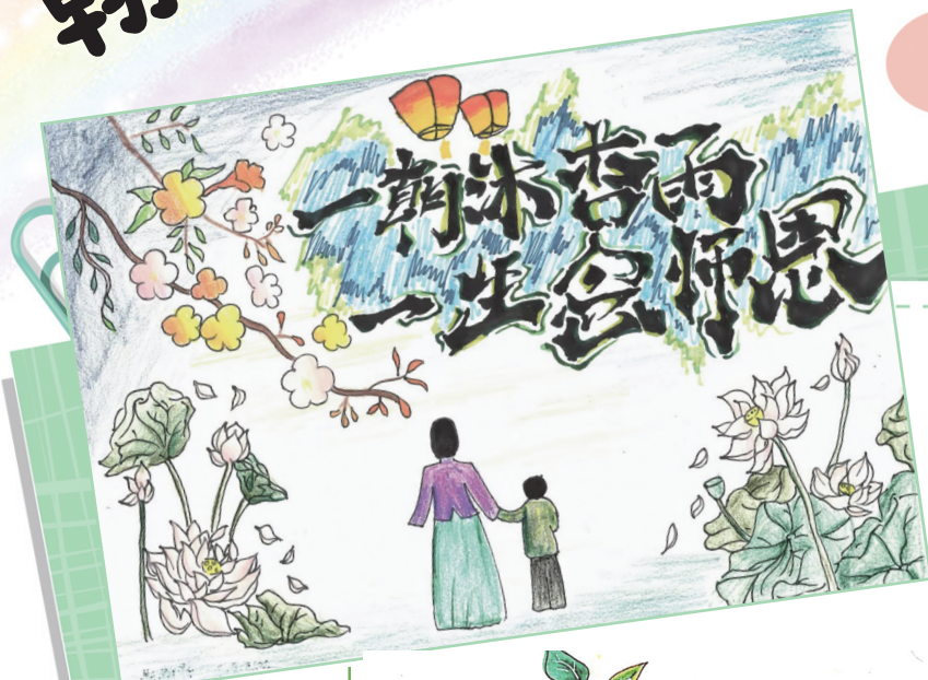
《一生念师恩》 遵义航天小学六(4)班 许鸣洋 指导老师:江凤