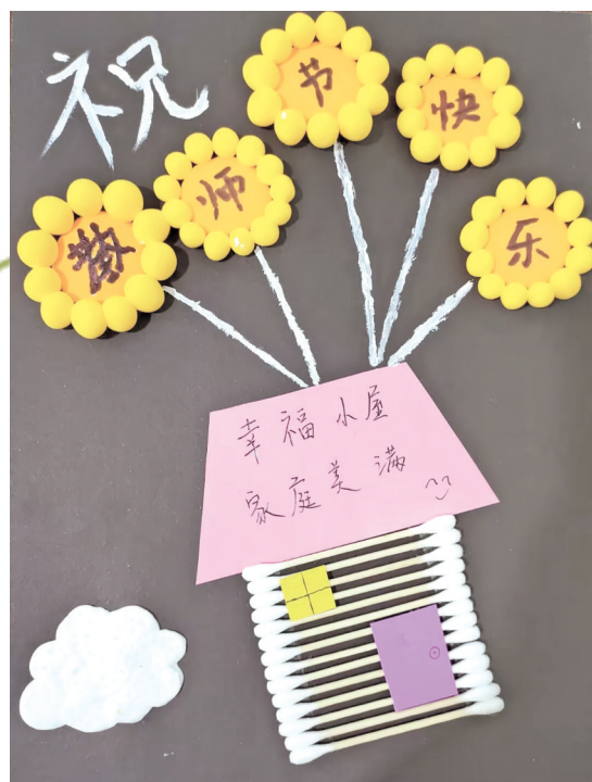
《教师节快乐》 黔南民族师范学院附属中学 2023级(3)班 刘宸麟