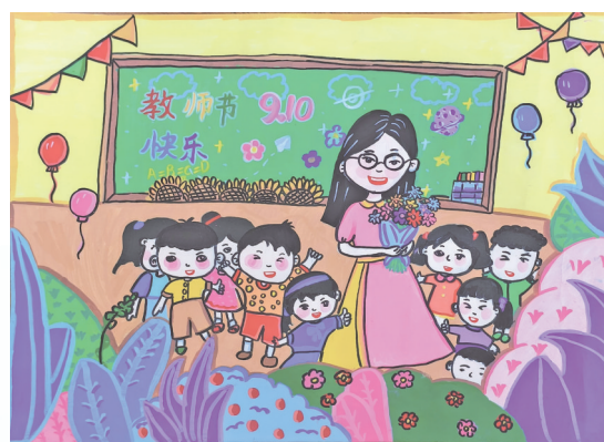
《老师,节日快乐》 黔东南州凯里市第二十一小学四(3)班 龙子怡 指导老师:杨青珍