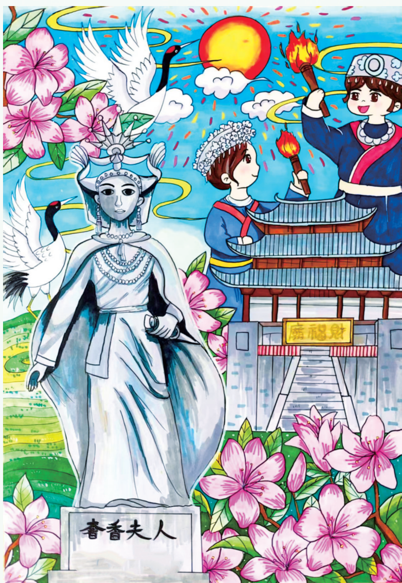
毕节奢香 彝韵流芳