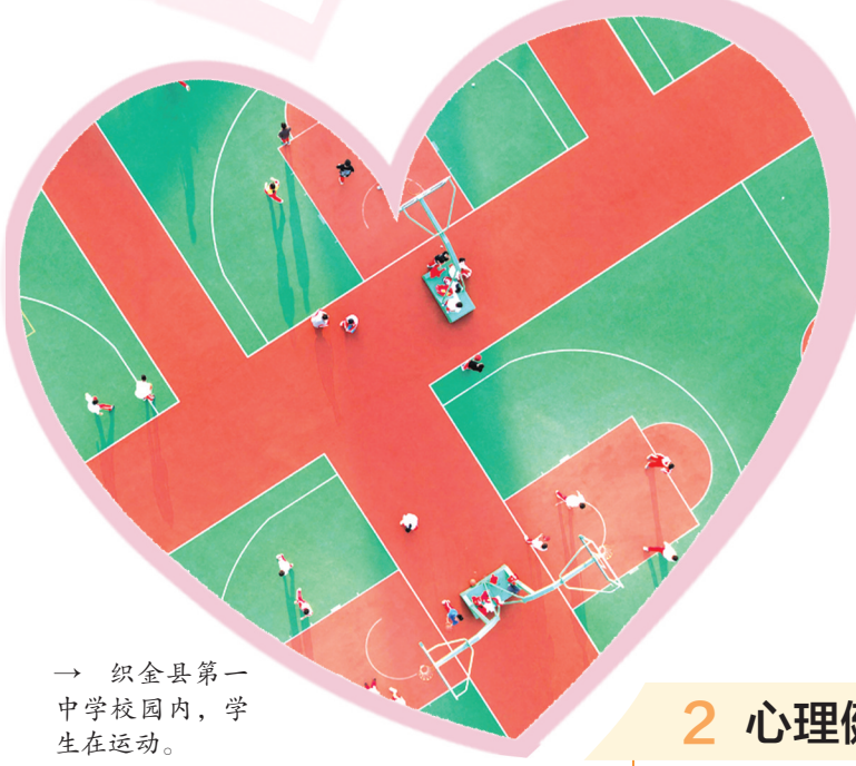
→ 织金县第一中学校园内，学生在运动。

然而，全县学校心理健康教育现状呈现出空白化与碎片化的状态，心理健康教育仅仅局限于学生主动寻求帮助，未纳入课程体系，专业心理教师仅有78名，学生缺乏系统学习心理健康知识的机会。