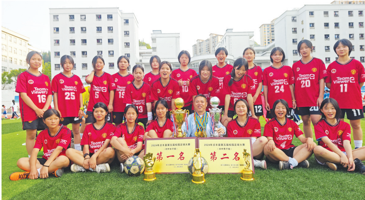
贞丰一中学生在2024年贞丰县校园足球大赛中获得初中女子组第一名、第二名。

贞丰县体育中心的足球场上，每周末都有火热的赛事；校园里，足球赛事蔚然成风；放假的日子，总能看到学生踢球的身影……校园足球，在贞丰开展得风生水起，也悄然改变着孩子们的命运。