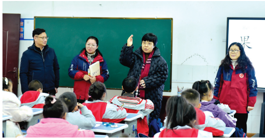
督导评估专家组对学校进行走访。

本报讯(特约通讯员 何可武)近日,贵州省人民政府教育督导室、贵州省教育厅督导评估组到荔波县开展国家义务教育优质均衡发展创建省级督导评估。