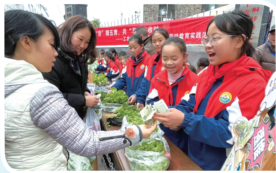
新鲜的时蔬很受受欢迎。

12月24日，遵义市桐梓县娄山关街道工农小学开展了一场独具特色的劳动教育实践活动——以“劳”铸五育，共“享”丰收时。本次活动将劳动教育与德智体美教育深度融合，旨在通过让学生亲身参与农产品的种植与销售过程，全面促进学生的综合素质发展。