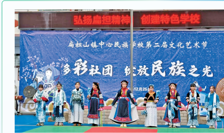
蜡染社团作品展示。