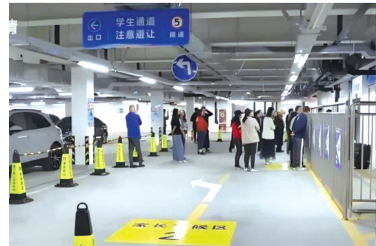
家长在停车场等待学生放学。

近日,青岛的崂山区实验学校正式启用学校新建的“地下停车场接送系统”,学校在地下车库设置家长等候区,并通过电子屏实时同步各班放学情况。这也是崂山区第三个启用该系统的学校。 在学校停车场内部设有醒目的行车及停车指引标识,学生家长验证审核身份后,进入学校内部,全程仅需1分钟。学生通过闸机进入地下停车场,电子屏幕就会立即显示孩子到达停车场的信息,家长就可以到指定位置接孩子放学。