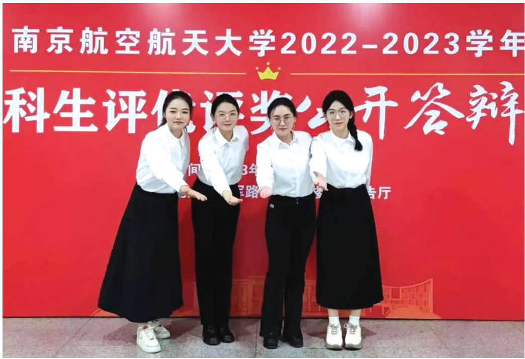
四女孩在本科毕业答辩上。