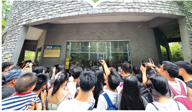
远道而来的游客只为看一眼“小老费”噘嘴卖萌的模样。