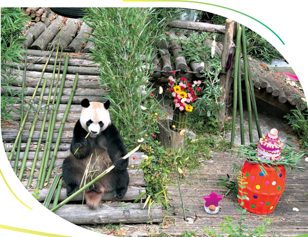
8月30日，过11岁生日的“星宝”，坐在生日蛋糕旁悠哉啃竹子。